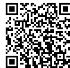
Hier kommen Sie zu unserem Erklärvideo: "Nicht aufzufallen kostet viel Kraft"