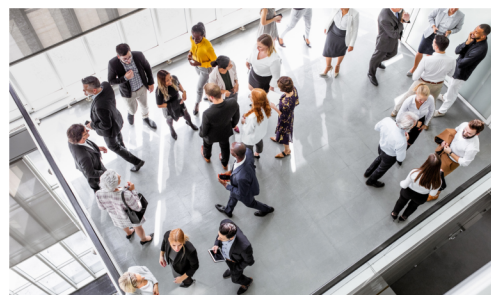
Autist:innen selbst entscheiden lassen, ob und unter welchen Bedingungen sie am Event teilnehmen können.