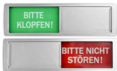
"Bitte klopfen/Bitte nicht stören"- Schild für die Bürotüre

Helfen Sie dabei, Kolleg:innen über Autismus aufzuklären, und wenden Sie sich an Stellen wie die "Einheitlichen Ansprechstellen für Arbeitgebende (EAA)", die Integrationsfachdienste (IFD) oder Autismus-Zentren, die Sie gerne unterstützen.